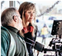
Louise Archambault / Canadá, 1970

Destacada directora de cine canadiense nacida en Montreal. Estudió cine en la Universidad de Concordia. Su primer largometraje, Familia (2005), recibió el Premio Claude Jutra en los Genie Awards. Alcanzó reconocimiento internacional con Gabrielle (2013), drama sin actores profesionales sobre una joven con discapacidad intelectual que fue seleccionado para representar a Canadá en los Oscar y ganó el premio del público en el Festival de Locarno. En su filmografía destaca Y llovieron pájaros (2019), que explora el envejecimiento y la resistencia, y Le temps d'un été (2023), sobre los sin techo. Para televisión hizo la serie Survivre à ses enfants (2021).