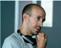
Simón Casal / España, 1984

Simón Casal es un director y guionista español nacido en 1984 en Madrid. Se formó en dirección de cine la Universidad de Cine y Audiovisuales de Cataluña (ESCAC). Entre sus cortos sobresale El mundo es nuestro (2012), multipremiado en festivales de cine. Su trabajo se caracteriza por explorar temas sociales y psicológicos, con formato de thriller, como en el largometraje Lobos sucios (2015). En televisión ha participado en el telefilm Eduardo Barreiros , el Henry Ford español y las series El Faro , cruce de caminos (2013-2016) y El reino suevo de Galicia (2019).