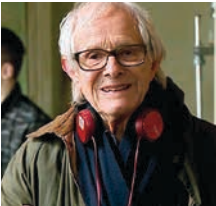
Ken Loach / Reino Unido, 1936

Uno de los grandes del cine británico, dos veces ganador de la Palma de Oro en Cannes. Cineasta social por excelencia, Ken Loach cuenta con una filmografía muy comprometida, que pone el dedo en la llaga al mostrar situaciones de injusticia de las clases humildes. Lo hace con un hondo sentido de la realidad, con estilo sobrio pero muchas veces altamente conmovedor. Entre su amplia filmografía pueden citarse títulos como Agenda oculta (1990), Lloviendo piedras (1993), Ladybird, Ladybird (1994), Felices dieciséis (2002), Buscando a Eric (2009), La parte de los ángeles (2012), Yo, Daniel Blake (2016). Casi nonagenario, según ha anunciado él mismo El viejo roble será su última película.