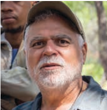
Benito Zambrano / España, 1965

Estudió Arte Dramático tres años, y comenzó a trabajar para televisión como fotógrafo y operador de cámara. Graduado en la Escuela Internacional de Cine y Televisión de San Antonio de los Baños, en Cuba. Su primera película como director, Solas (1999), tuvo una enorme repercusión entre público y crítica, y obtuvo 5 premios Goya, entre ellos el de guión y dirección novel, de un total de 11 nominaciones. Ha dirigido también Habana Blues (2005), La voz dormida (2011), Intemperie (2019) y Pan de limón con semillas de amapola (2021).