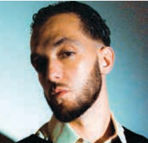
C. Tangana / España, 1990

La guitarra flamenca de Yeraí Cortés / 2024 / España