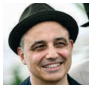
Pablo Berger / España, 1963

Nacido en Bilbao, estudió primaria y secundaria en la escuela San Vicente y luego en el Colegio Trueba de Artxanda. En 1988 dirigió su primer cortometraje, Mamá , con dirección artística de Álex de la Iglesia. Hizo un máster en cine en la New York University, donde dirigió el corto Truth and Beauty , nominado a los Emmy. Después, fue profesor de dirección en la New York Film Academy (NYFA). A partir de entonces, se dedicó a la publicidad y a la realización de videoclips. Su ópera prima, la coproducción hispano-danesa Torremolinos 73 (2003), recibió numerosos premios. A continuación dirigió, Blancanieves , seleccionada para representar a España en los Premios Oscar y ganadora de 10 Premios Goya, y Abracadabra , protagonizada por Maribel Verdú.