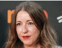
Pilar Palomero / España, 1980

Directora y guionista nacida en Zaragoza. Estudió en la Universidad de Zaragoza y en la ECAM de Madrid, e hizo un Máster en Dirección en Sarajevo con el cineasta húngaro Béla Tarr. Entre sus cortos sobresalen Niño balcón (2009) y La noche de todas las cosas (2017). Debutó a lo grande en el largometraje con Las niñas (2020), que se llevó el Goya a la mejor película. Le interesan sobre todo las historias intimistas como demuestran La maternal (2022) y Los destellos (2024), aunque también tiene trabajos alimenticios como sus capítulos de la serie Venga, Juan (2021).