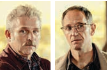
Aitor Arregi, Jon Garaño / España, 1974, 1977

Marco, la verdad inventada / 2024 / España