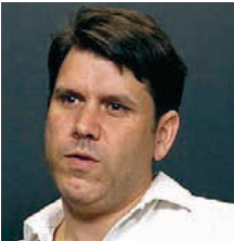
Santiago Requejo / España, 1985

Según sus propias palabras, Requejo busca "contar historias con alma". Después de fundar su propia productora, 02:59 films, y adentrarse en el mundo del cine con numerosos cortos y videoreportajes, debutó en la ficción en la gran pantalla con Abuelos (2008), que tuvo una considerable repercusión, y cinco años después entregó la comedia No puedo vivir sin ti , sobre la adicción al móvil. En 2021 cosechó un gran éxito de crítica con su corto Vótamos , nominado al Premio Goya, cuyo planteamiento sirvió más tarde para elaborar el largometraje Votemos , su última película hasta la fecha.