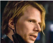
Tim Fehlbau / Suiza, 1982

Nacido en Basilea, inició su carrera realizando cortometrajes. Su debut en la gran pantalla fue Hell , una película de terror producida en 2011 por Ralnd Emmerich, que presentaba un terrorífico futuro distópico donde el sol era la mayor amenaza. Diez años después repitió con otra historia futurista, The Colony , de mayor presupuesto. Protagonizada por actores más conocidos, como Nora Arnezeder y Iain Glen, contaba el regreso a la Tierra de unos astronautas dos generaciones después de instalarse en otro planeta. Septiembre 5 es su tercer largometraje.